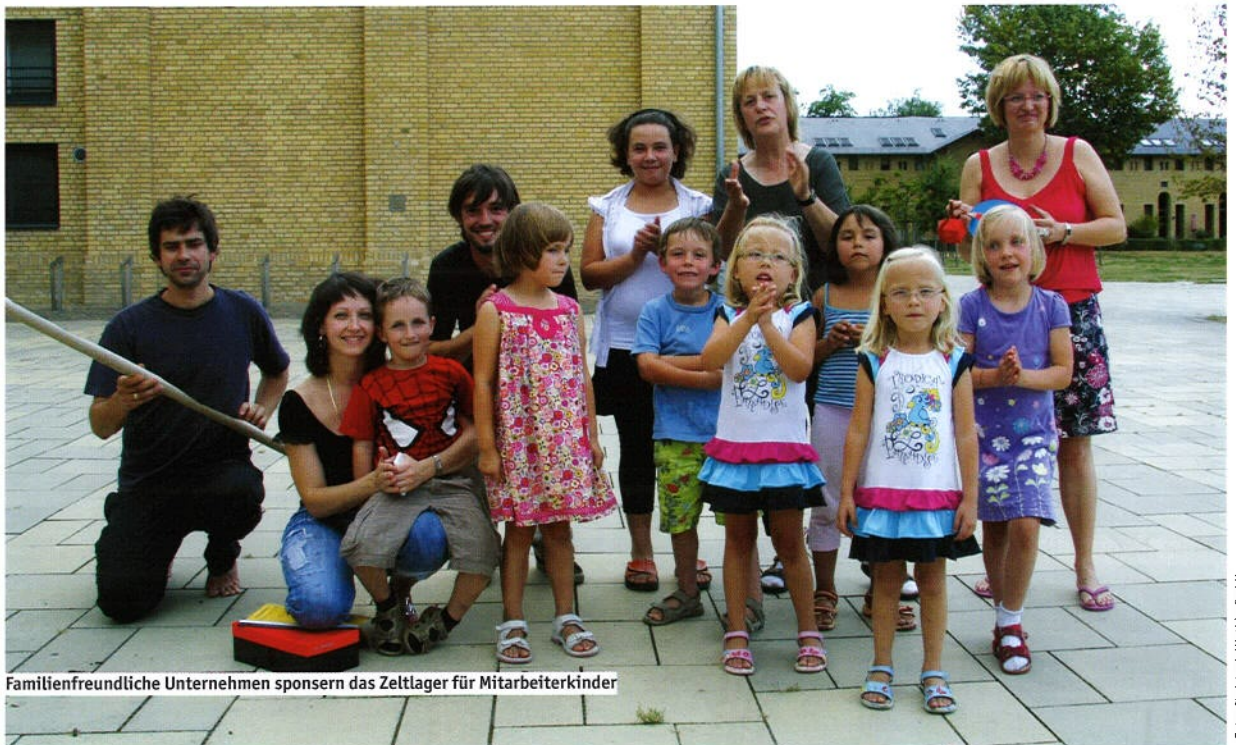
Familienfreundliche Unternehmen sponsern das Zeltlager für Mitarbeiterkinder